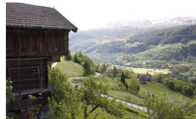
Kulturlandskap i Hjartdal kommune.

FMK har sine røtter tilbake i 1918 med stiftelsen av Norske museers landsforbund (i dag Norges Museumsforbund), som jobbet for lønns- og arbeidsvilkår for vitenskapelig ansatte i museer. I 1949 ble dette skilt ut i foreningen for Vitenskapelige tjenestemenn ved museer (VTM), som var en av stifterne av Forskerforbundet. I 1994 skiftet VTM navn til FMK – Forskerforbundet ved museer og kulturminnevern.