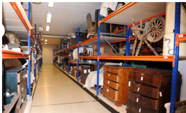
Fra Vestfoldmuseenes felles magasiner for kulturhistoriske gjenstander.