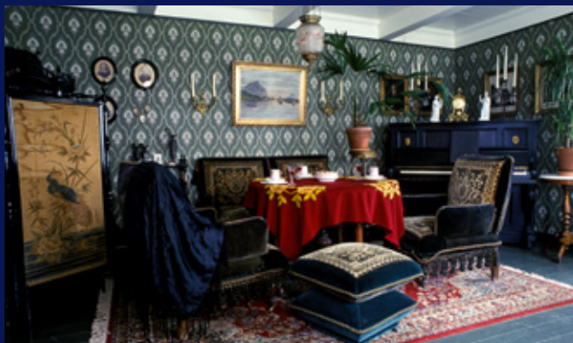
Den rekonstruerte Klunkestua i Perspektivet Museum – Folkeparken, Tromsø.