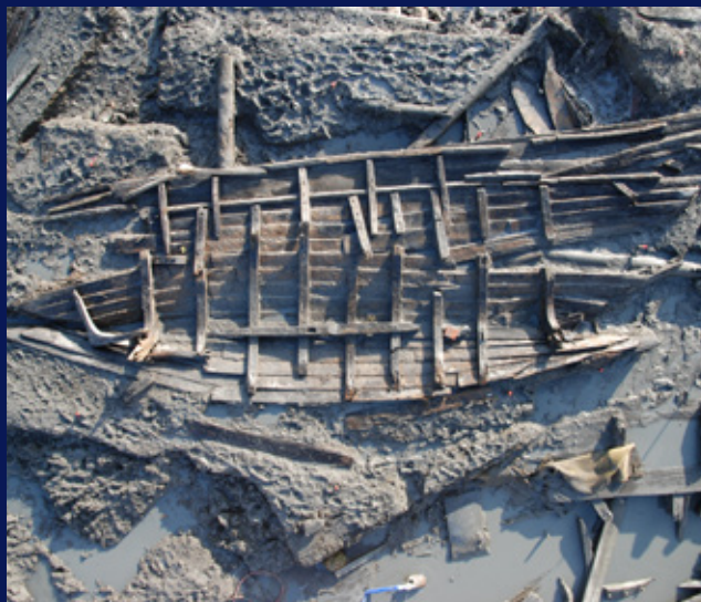
Oversiktsbilde over BC03 fra utgravning på Barcode B11-13, Bjørvika i Oslo (2008-09).