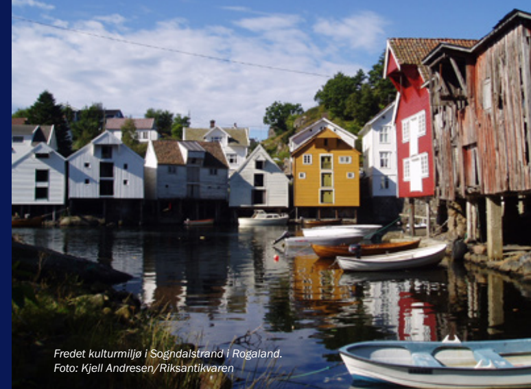
Fredet kulturmiljø i Sogndalstrand i Rogaland.