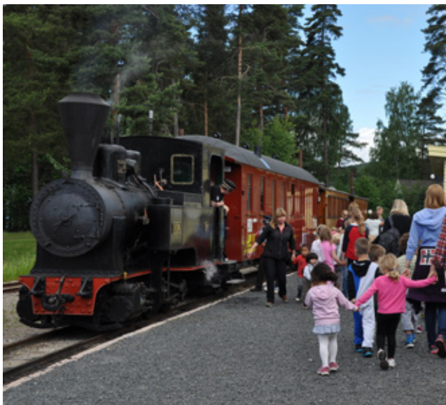
Norsk jernbanemuseums "Tertittoget" har tøffet daglig gjennom museumsparken om sommeren siden 1962.

Samtidig forventes det at museene skal inkludere og involvere publikum mer i sitt arbeid. De siste årene har museene opplevd stagnerende offentlige bevilgninger. De fleste har store etterslep i digitalisering og tilgjengeliggjøring av samlingene. Forskning har de siste årene vært definert som en av museenes kjerneoppgaver, og det forventes at museene setter av tid til og øker sin kompetanse i forskning på sine fagområder.