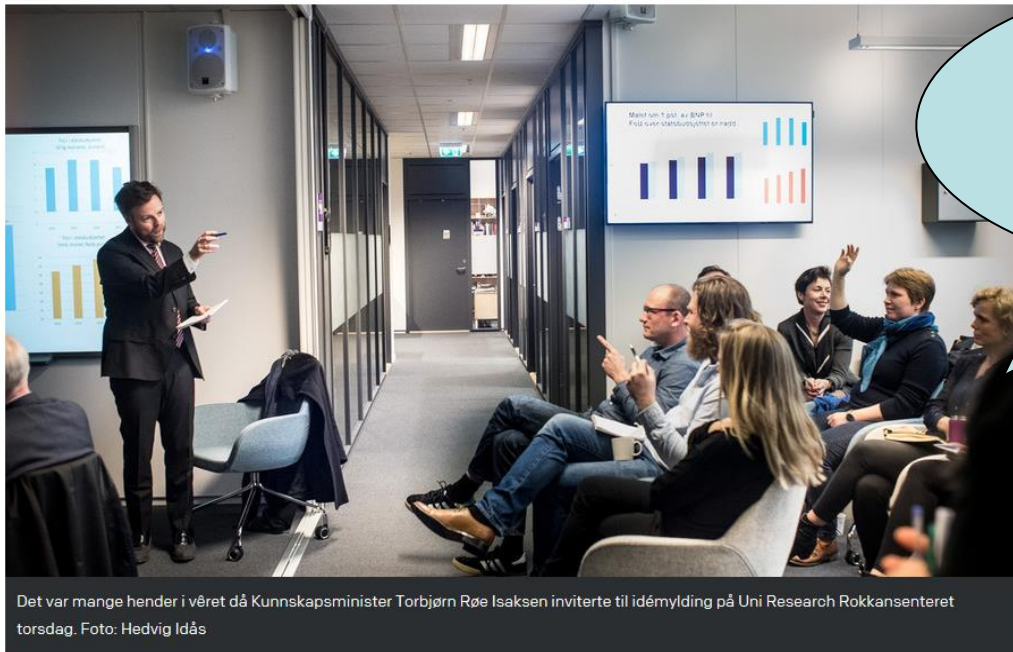
Det var mange hender i været da Kunnskapsminister Torbjørn Røe Isaksen inviterte til idémyldring på Uni Research Rokkansenteret torsdag.

Publisert: 24. mars 2017 Oppdatert: 24. mars 2017, 17:01